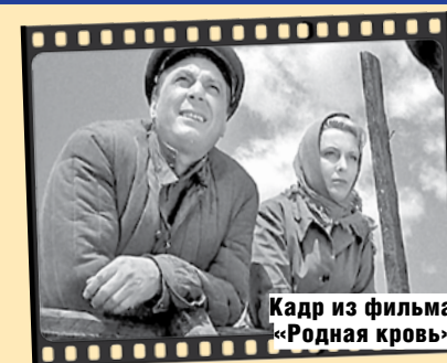
Кадр из фильма «Родная кровь»

● Академик Дмитрий Лихачев присылал свои книги в местную библиотеку, содействовал в выделении средств на реставрацию памятников архитектуры Мышкина. Но так и не успел здесь побывать. Однако заочно признавался городу в любви: «...я люблю этот Мышкин, и название его мне нравится, и положение, и виды его, которые я знаю по фотографиям... я переживаю за его судьбу».