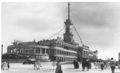
Общий вид со стороны перрона, 1941 год