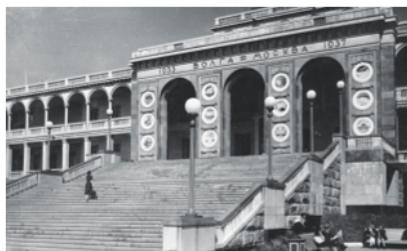
Вид с перрона на центральную часть здания и лестницу, 1941 год

Северный речной вокзал полностью симметричен: в нем дублируют друг друга все боковые части с четырех сторон света, но в каждой есть свои неповторимые детали. Если присмотреться, то вокзал напоминает корабль: центральная часть с главным входом и башней — корпус корабля с каютами. Вереница колонн — будто огороженная палуба. А шпиль со звездой на башне — мачта, на которую еще не водрузили парус.