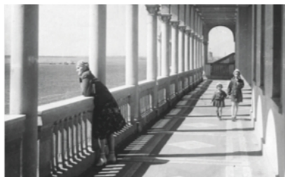
Галерея, выходящая на перрон, 1941 год

В 1936–1938 годах по проекту инженера Тимофея Шафранского на территории вокзала был разбит парк площадью 24 га. В основу планировки легла осевая композиция с системой перпендикулярных аллей.